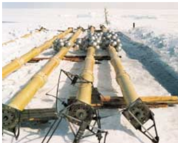
Fig. 1 Un fotomoltiplicatore sviluppato per l'esperimento DUMAND