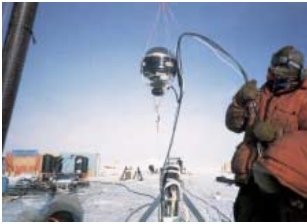
Fig. 3 Rivelatori dell'esperimento AMANDA pronti per essere immersi nel ghiaccio del Polo Sud

fotoni emessi dalle sorgenti gamma derivano dal decadimento di particelle \pi^0 (pioni neutri), perché allora ci saranno anche particelle \pi^\pm (pioni carichi), il cui decadimento produce i tanto cercati neutrini.